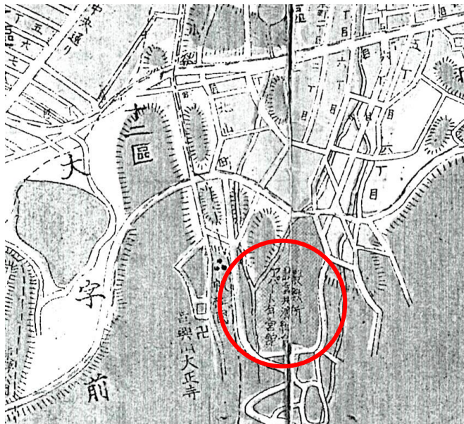
「製鉄所 請負共済組合 アパート有営館」と記載